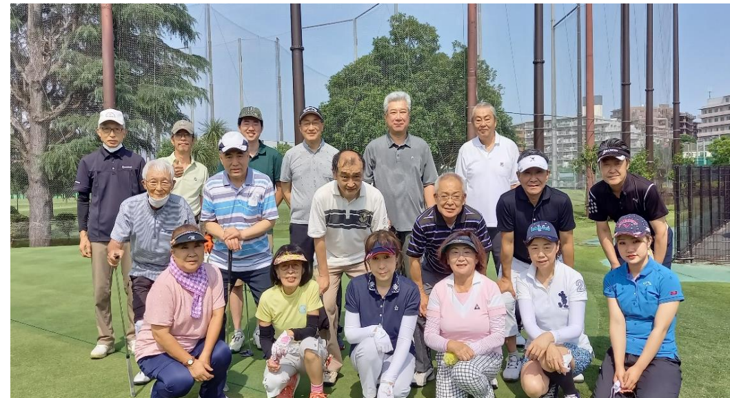
第35回大会のスナップ(2022/6/19開催)