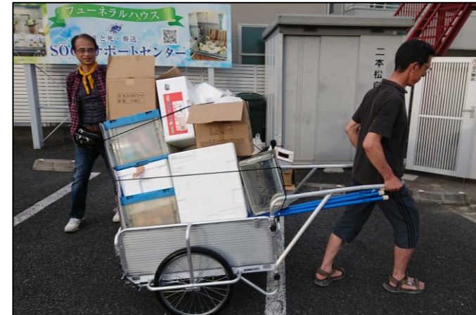
折りたたみ式リヤカー (BBQ大会時、備品運搬の様子)

➤ エリアマップに追記 ⇨ 洪水時の 避難方向 表示、 AED設置場所(*3) の表示