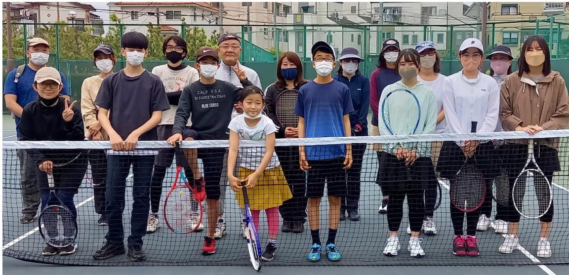
集合スナップ(2022/5/8開催)