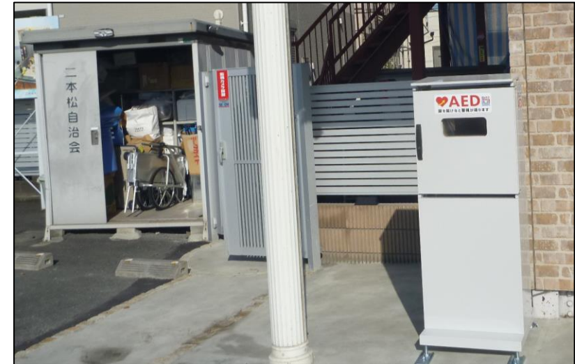
防災倉庫(左側)と屋外型AED収容BOX