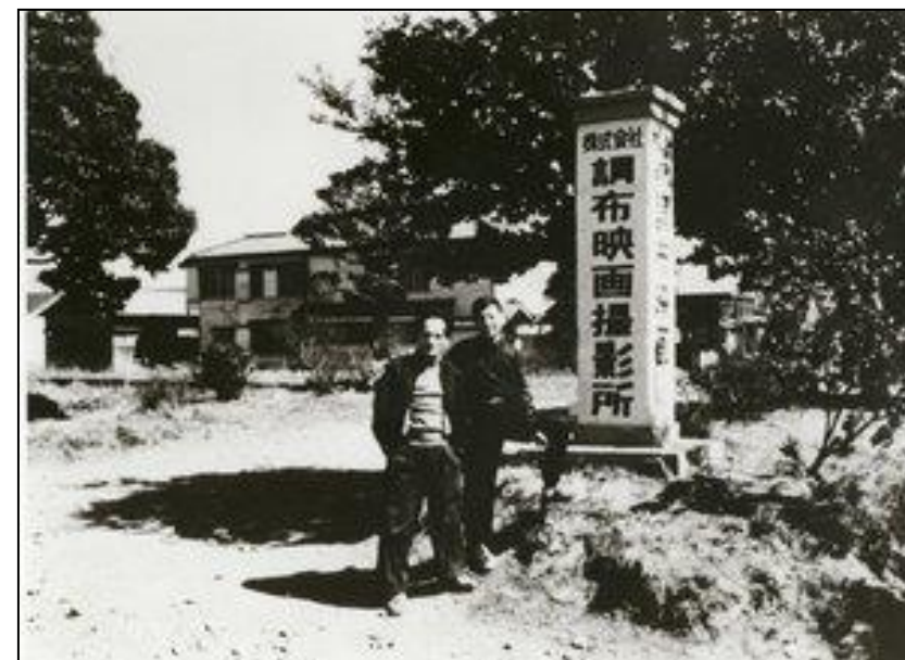
調布映画撮影所入口付近