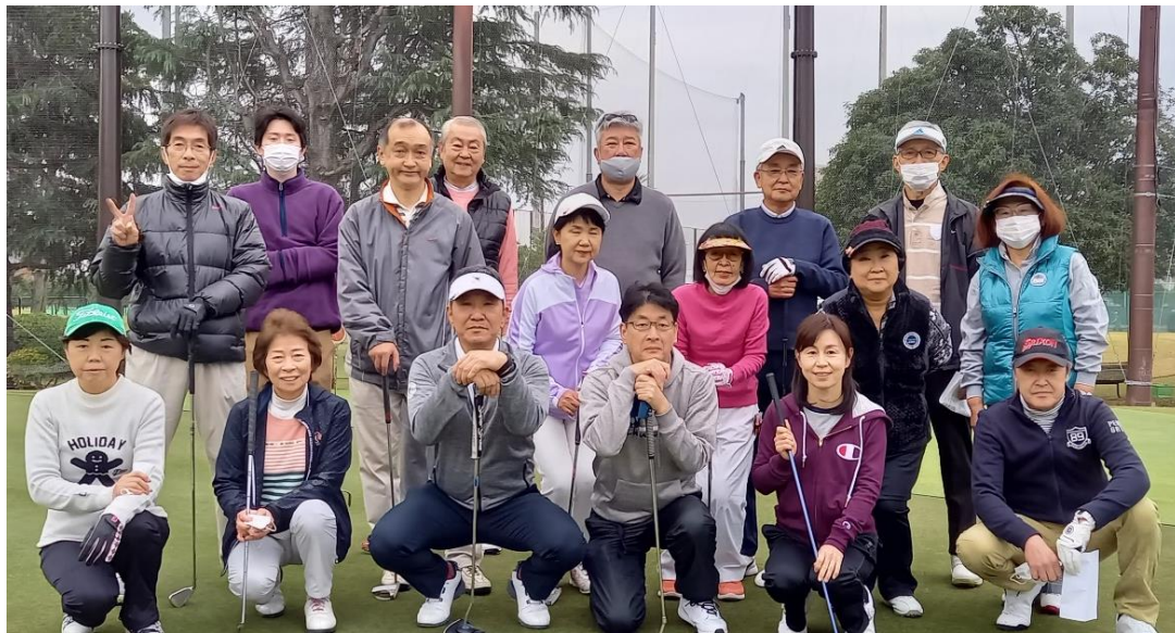
第34回大会のスナップ(2021/11/21開催)