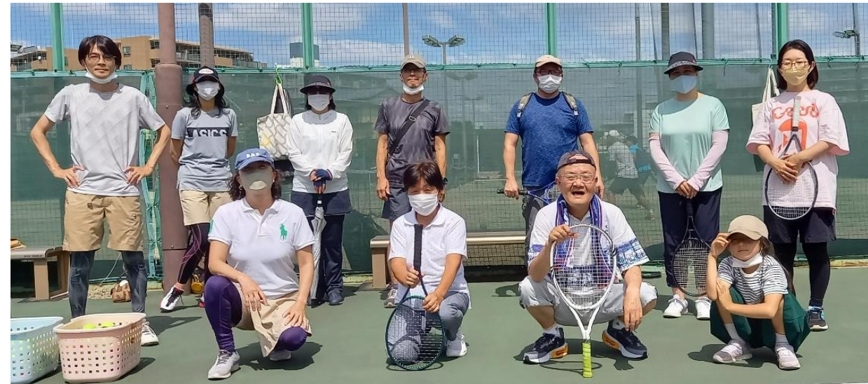
集合スナップ(2022/9/11開催)