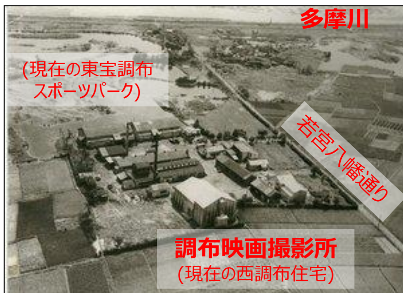
昔の二本松自治会エリア付近の写真