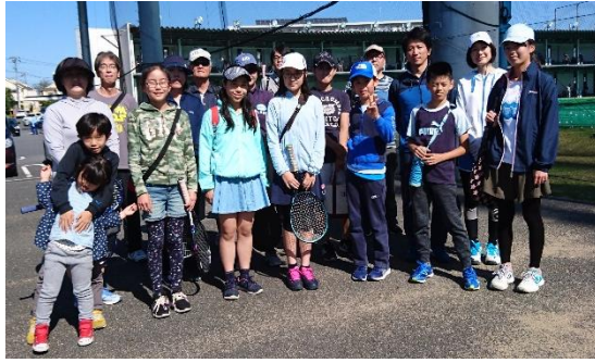
集合スナップ・お疲れ様でした