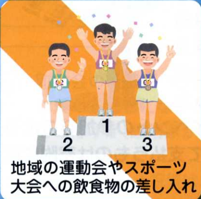
地区の運動会やスポーツ大会への飲食物の差し入れ