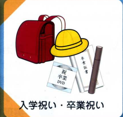
入学祝い・卒業祝い