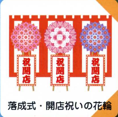
落成式・開店祝いの花輪