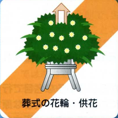
葬式の花輪・供花