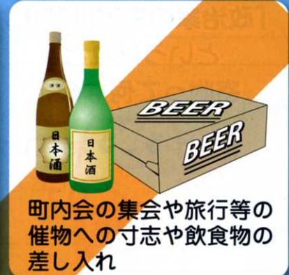
町内会の集会や旅行等の催物への寸志や飲食物の差し入れ