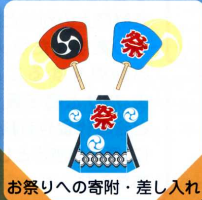
お祭りへの寄附・差し入れ